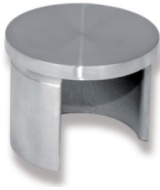
316.860.042 Ende flens