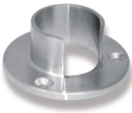
316.870.042 Bevegelig bend til trapper